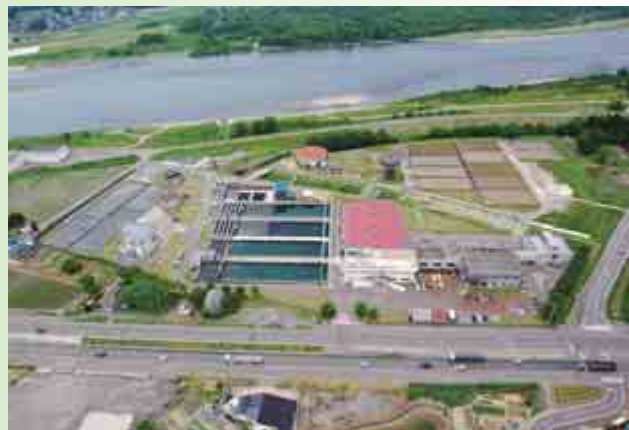
妙見浄水場 長岡地域