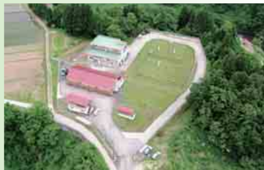
大貝浄水場 小国地域

軟水で味にくせがなく、適度に硬度があり、まろやかな味わいです。長岡でもっとも広い地域に給水されており、代表的な水質といえます。