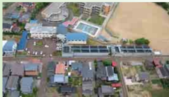
与板浄水場 与板・三島・和島地域