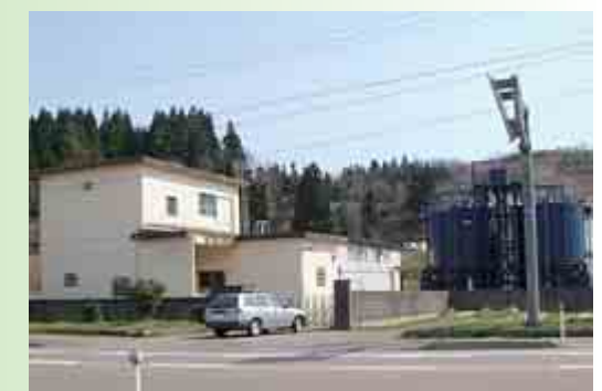
川口中央簡易水道浄水場

硬度が高めで、中程度の軟水に位置づけられます。コクが強く、さわやかさを感じさせる遊離炭酸も豊富に含まれます。通年の水質・水温変化が小さいことも特徴です。