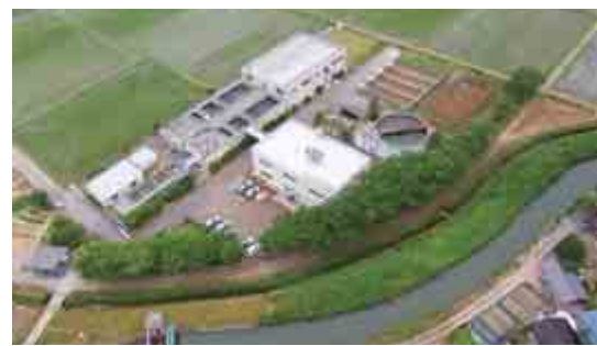
寺泊浄水場 寺泊地域