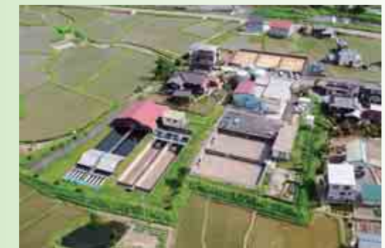
栃尾浄水場 栃尾地域