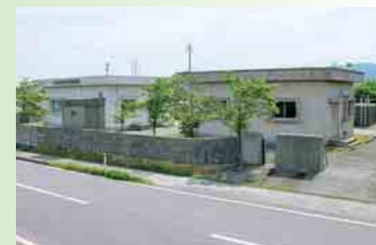
越路浄水場 越路地域

長岡市の中でとくに硬度が低い軟水で、すっきりしていてくせがありません。残留塩素も低いレベルに維持でき、臭気もほとんどありません。