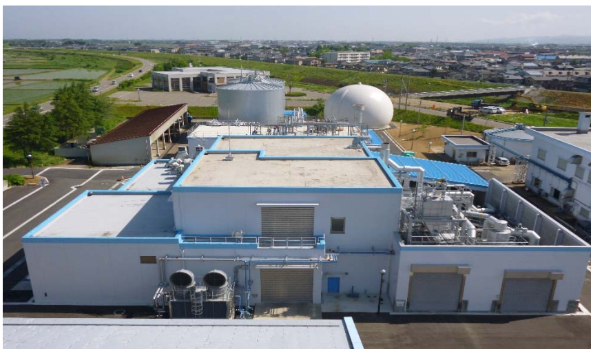
生ごみバイオガス発電センター