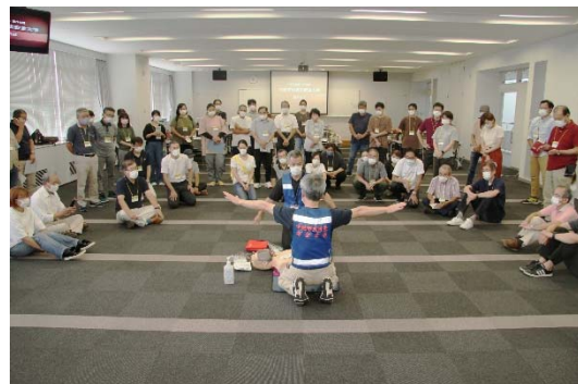
中越防災安全大学受講の様子