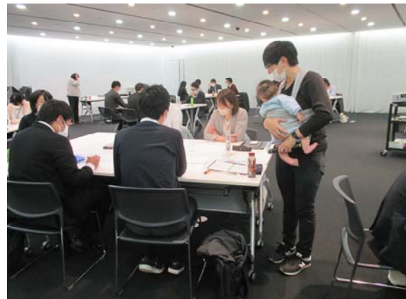
圏域職員合同研修