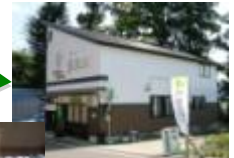
農家レストラン・直売所