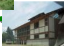
ビジターセンター