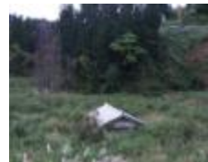
木籠 メモリアルパーク