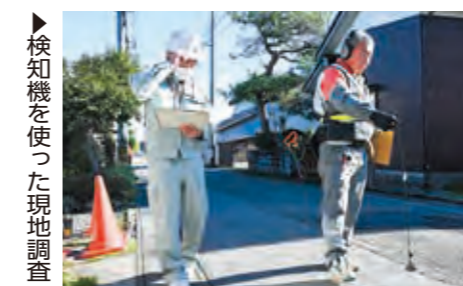
検知機を使った現地調査