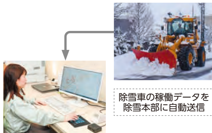
除雪車の稼働データを 除雪本部に自動送信

事務所からも除雪車の稼働状況を把握できるので、現場の作業員への的確な指示を出せるようになりました。事故や災害による緊急対応や運行ルートの変更があっても柔軟に対応できます。