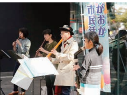
▲リコーダー音楽部による演奏