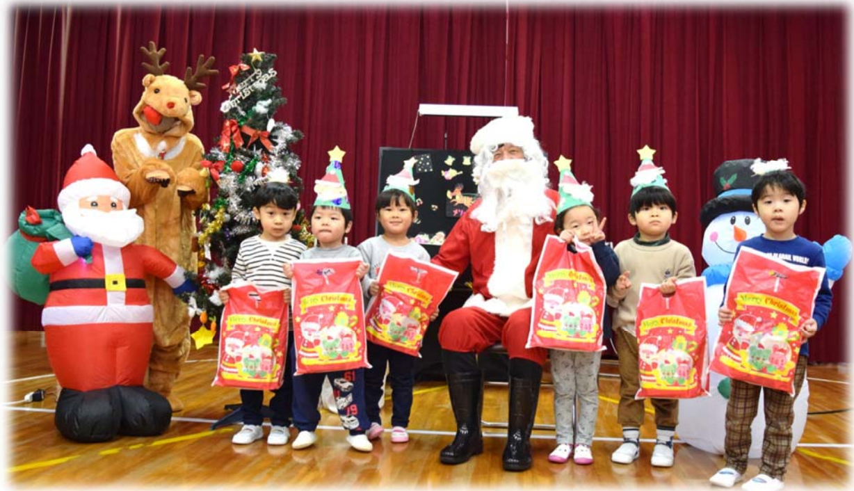
(12月22日 幼稚園クリスマス会)