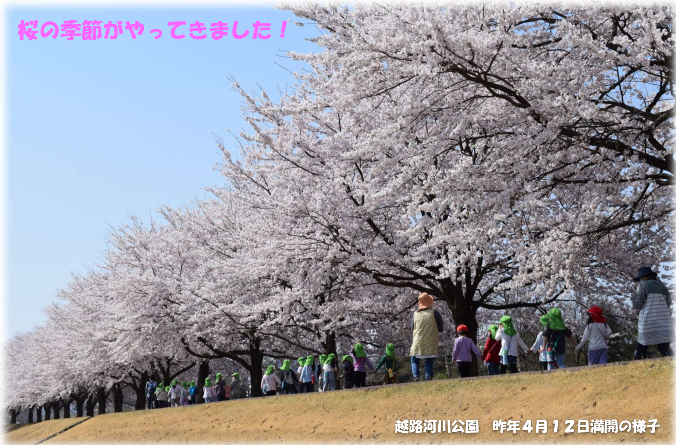
越路河川公園 昨年4月12日満開の様子