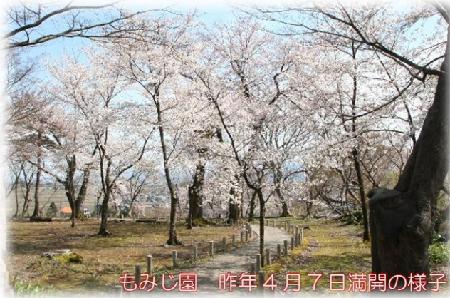
もみじ園 昨年4月7日満開の様子