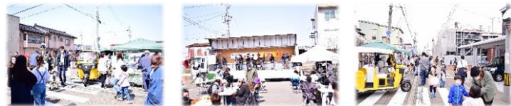
来迎寺ていしゃば通りで春もみじフェスが開催されました。(3月20日)