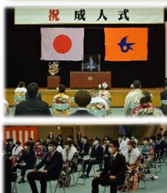
延期となっていた令和2年度越路地域成人式が挙行されました。(3月6日)