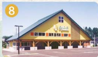
8 まちの駅 あぐりの里 道の駅 越後川口 あぐりの里