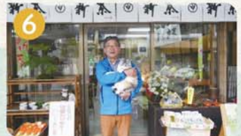
6 日本茶の駅 広野茶店