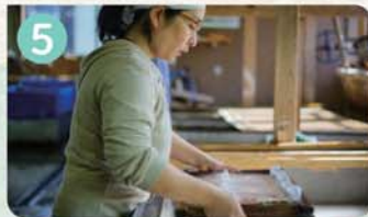
5 和紙の駅 おぐに和紙の店