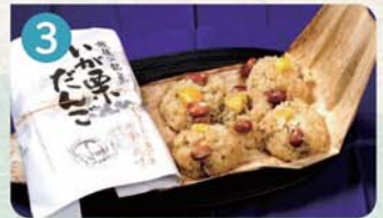
3 まちの駅 菓子処 越後物語 (株)西山製菓