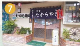
7 あぶらげ巻き寿司の駅 食堂たからや