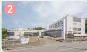
2 まちの駅 長岡大学 長岡大学