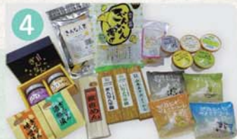
4 ぎんなんアイスクリームの駅 (有)山岸モータース・小国町特産品