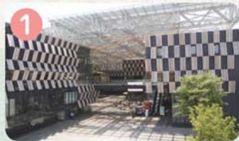
1 ながおか まちの駅 アオーレ長岡・ながおか市民協働センター