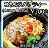
コネルキッチン ハンバーグとパスタ