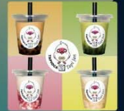
タビちゃん タピオカドリンク