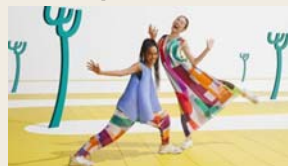
'PLEATS PLEASE ISSEY MIYAKE' 30周年 Movie/Graphic