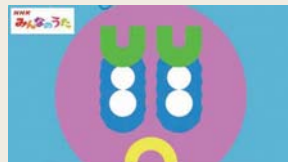
NHK みんなのうた「愛w君(アイダブリュー)」Movie