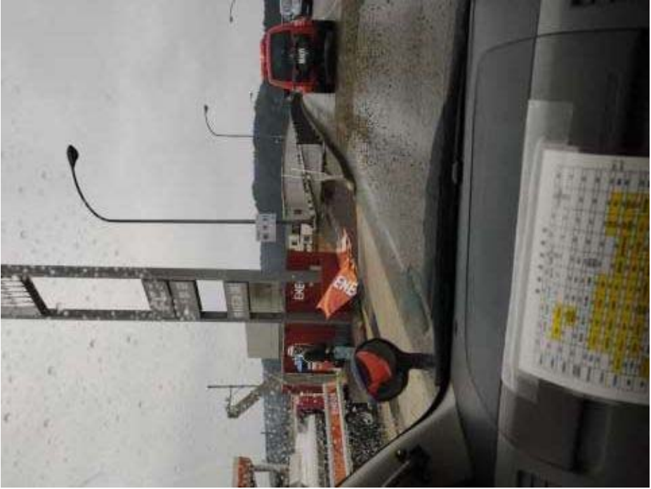
(十郎原地区の状況)