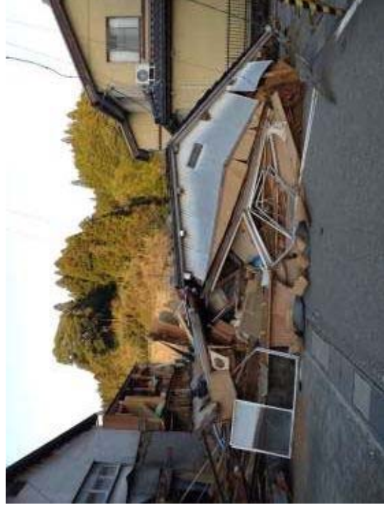
(十郎原地区の状況)