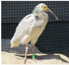
〈今年生まれた幼鳥〉