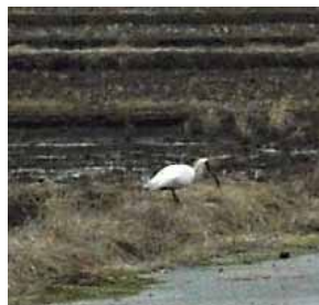
本市南部に飛来したトキ

1.多様な生態系、多様な生物種、同種内における多様な遺伝子が存在しているということ。