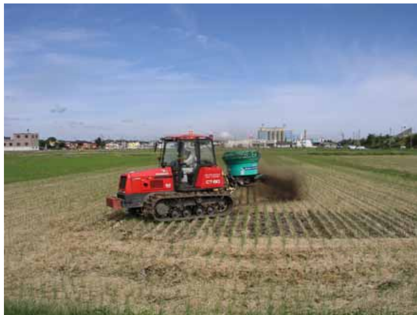
堆肥の散布(越路地域)

2.堆肥や稲わら等の有機物を土壌中に投入すると、それに含まれる炭素は微生物により分解され、一部は大気中に放出され、一部は長期間土壌中に貯留される。その差し引きが農地土壌による吸収・排出量となる。有機物の投入を増やすこと、耕起による土壌のかく乱を少なくすることが二酸化炭素の吸収・排出抑制に有効とされる(参考：農林水産省、農業農村整備における地球温暖化対応策のあり方)。