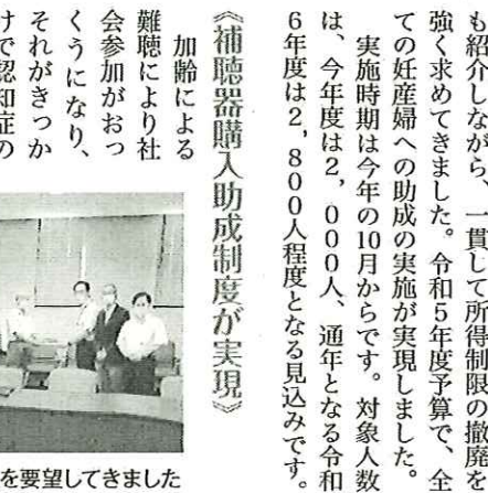
市民と制度の導入を要望してきました

《補聴器購入助成制度が実現》 加齢による難聴により社会参加が困難になり、くうになり、それがきっかけで認知症の発症につながるものが社会問題となっています。党市議団はその対策として、全国で広がっている補聴器購入補助制度の導入を要望してまいりました。令和5年度予算で、所得制限なしで購入費の2分の1(上限25,000円)を助成する制度が導入されることとなりました。 《国保料の負担軽減を図る、市答弁》 長岡市はここ3、4年、国保料の値上げは行っていないが、高い状況にあることに変わりはありません。党市議団は、一貫して引き下げを求めてまいりました。市は、価格高騰による市民生活の影響が出ていることから、国保の財政調整基金を活用して、被保険者の負担軽減を図る考えを示しました。