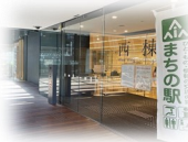
Machi no Eki