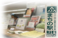
Machi no Eki