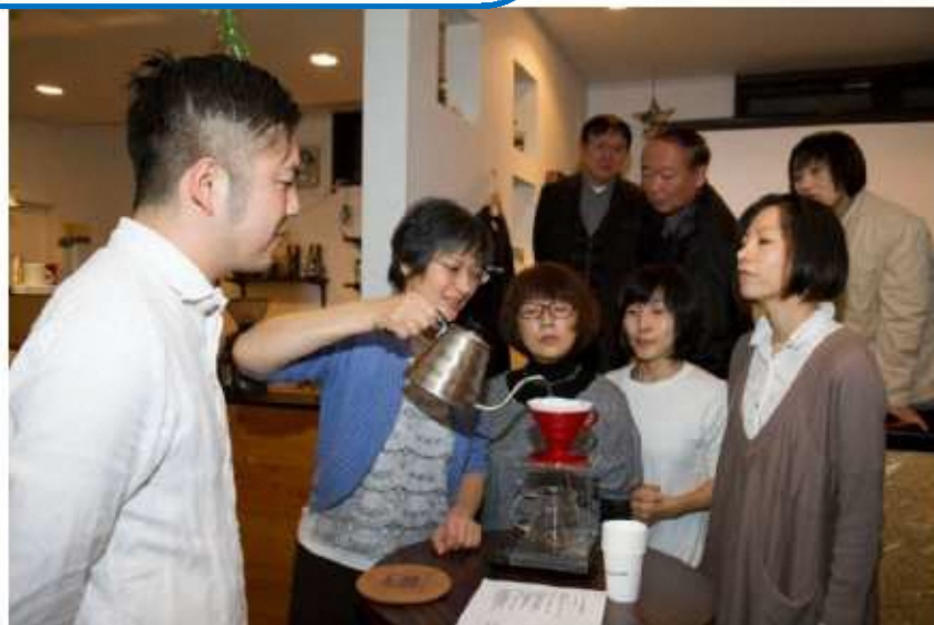
▲シニア向け講座 手軽に美味しいドリップコーヒー