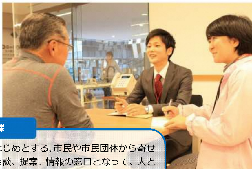
▲ながおか市民協働センター相談窓口