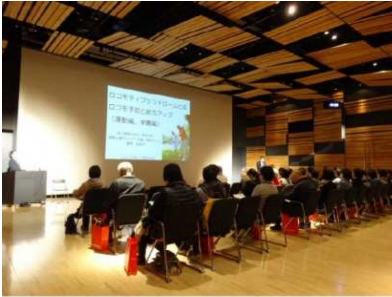
▲「ながおかタニタ健康くらぶ」セミナー