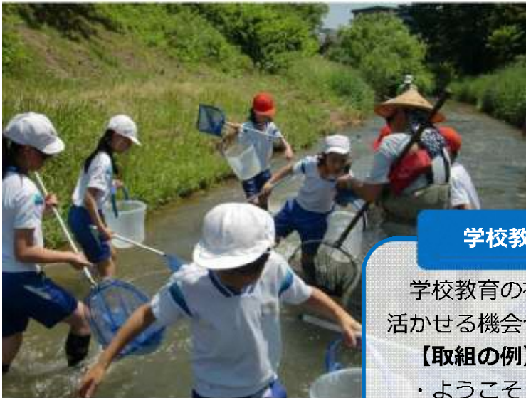
▲柿川探検（ようこそ「まちの先生」）