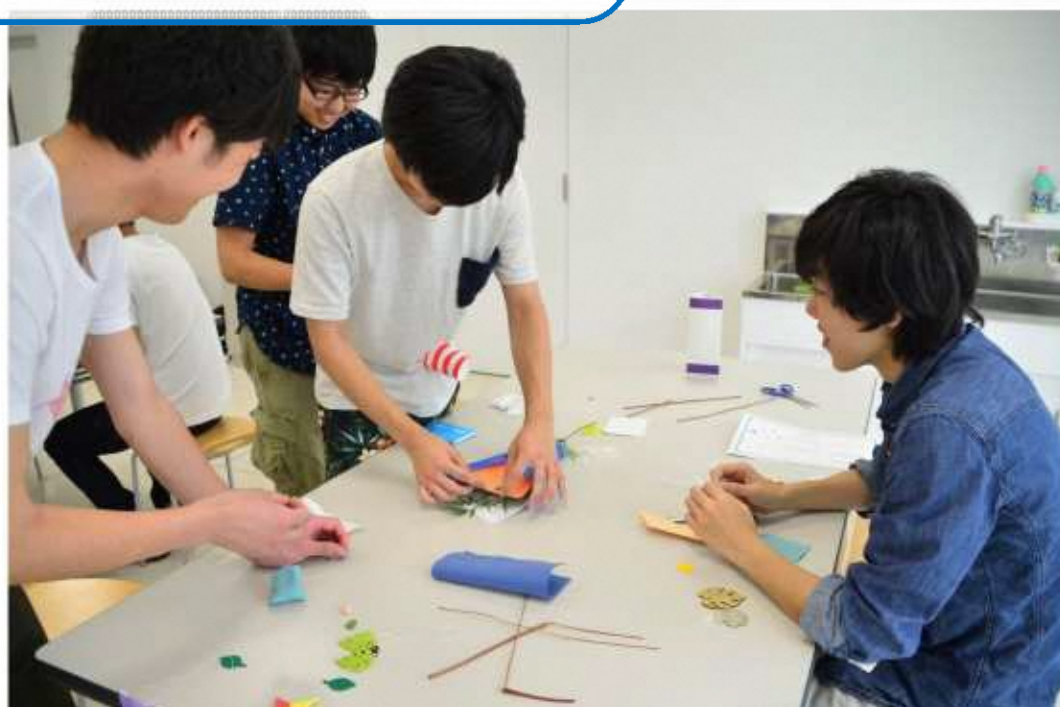
▲七夕に向けてモビールづくり（学生交流イベント）