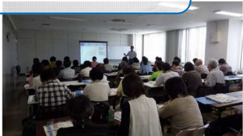
▲介護予防の知識を身に付けた市民サポーター「転ばん隊」の研修