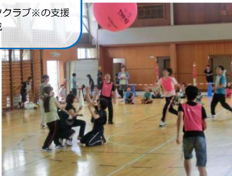
▲コミュニティスポーツクラブの活動