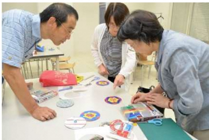
▲まちキャン市民プロデュース講座「ミドル・シニア世代の科学教室」

なお、本計画に掲載されていない取り組みについては、各分野において個別に策定された計画等に基づいて実施していきます。