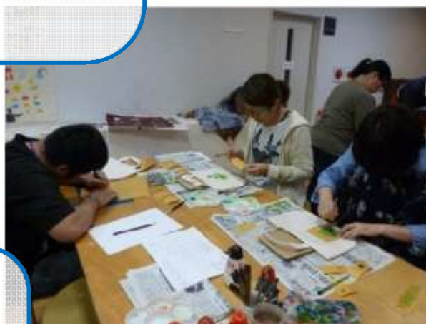
▲型染めでオリジナルランチバッグづくり (栃尾美術館)