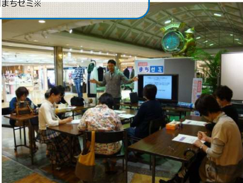
▲長岡まちゼミ「はじめてのアロマテラピー」