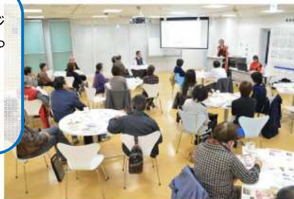
▲大河ドラマの見どころを先取り（まちなかカフェ）