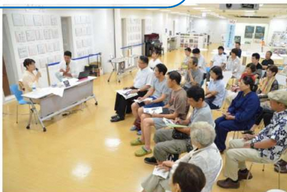
▲講義に聞き入る受講生（企業プロデュース講座）