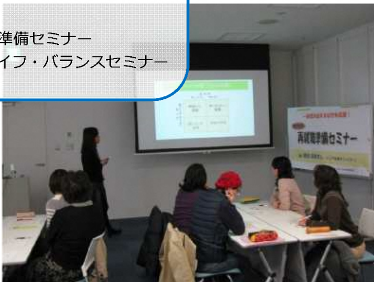
▲女性のための再就職準備セミナー