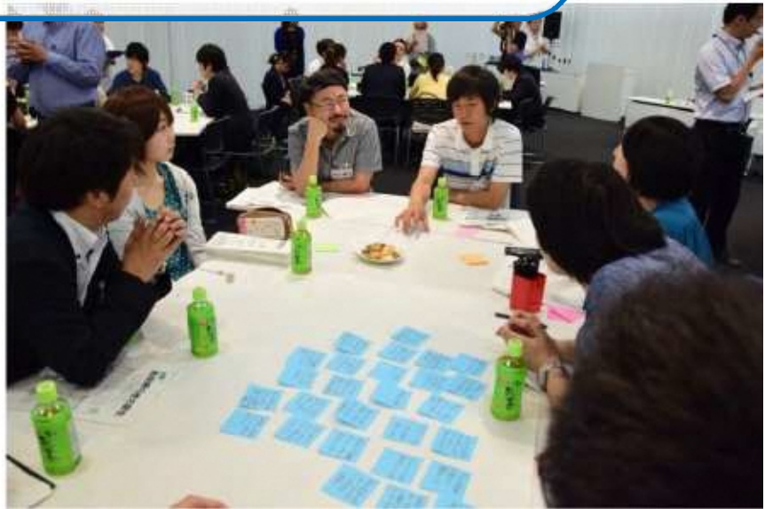
▲30代までの若者がまちづくりを提案する場「ながおか若者会議」