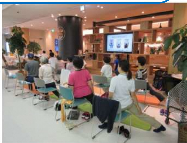
▲タニタカフェ健康ミニセミナー