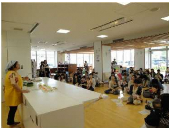
▲子育ての駅ぐんぐん

地域で子育てを応援している母子保健推進員が、子どもを預かり見守る中で、親同士がお茶を飲みながら子育ての情報交換するなどしてゆったりとした時間を過ごしてもらうカフェ。