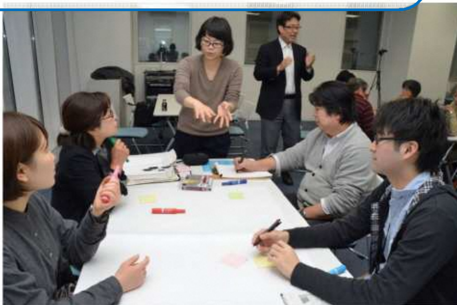
▲提案に向け議論を深める（まちづくり市民研究所）