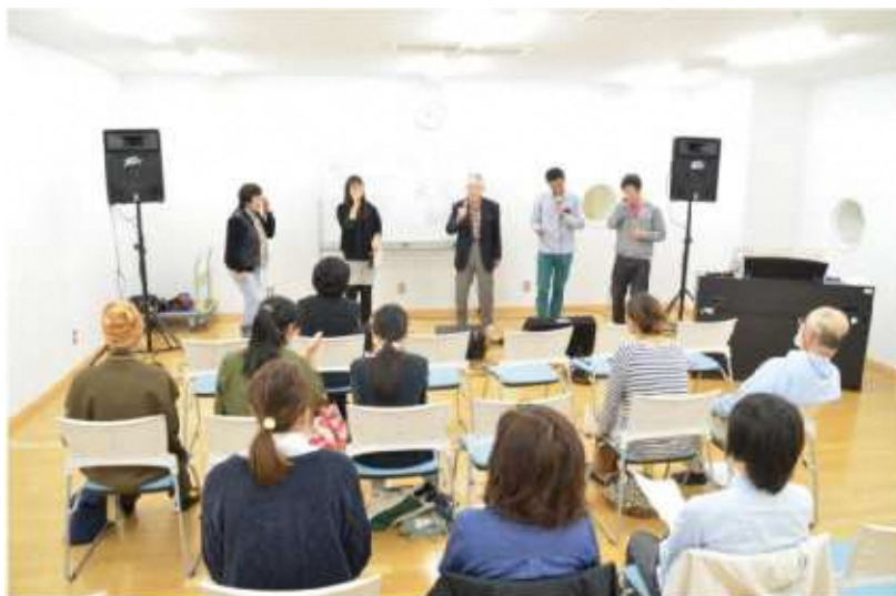
▲アカペラ体験講座（市民プロデュース講座）

「自分がまなんだことを伝えたい」「夢中になっている活動を広めたい」「自分が企画して、あの人を講師に招きたい」など、講座にチャレンジしたい市民をまちなかキャンパス長岡が協力して開催する講座。