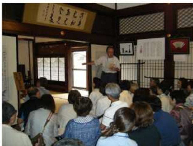
▲生涯学習推進大学 館外学習