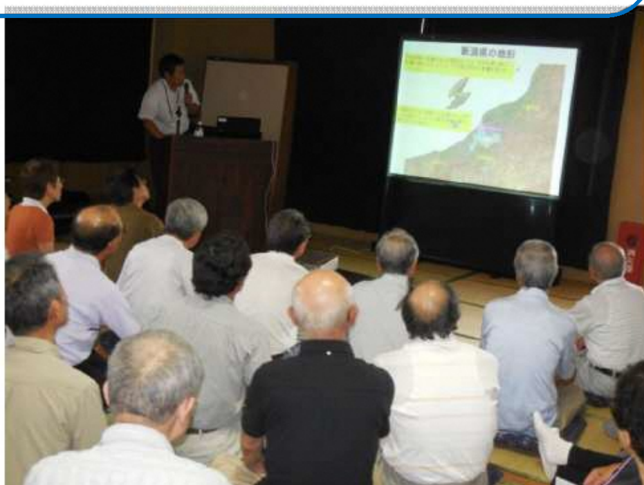
▲上川西生涯学習教室（通称ニコニコ大学 上川西コミュニティセンター）