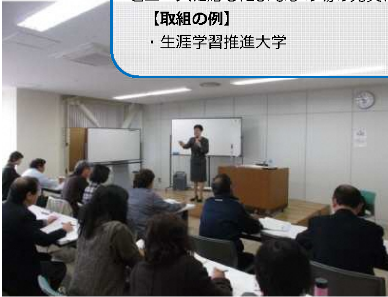
▲生涯学習推進大学