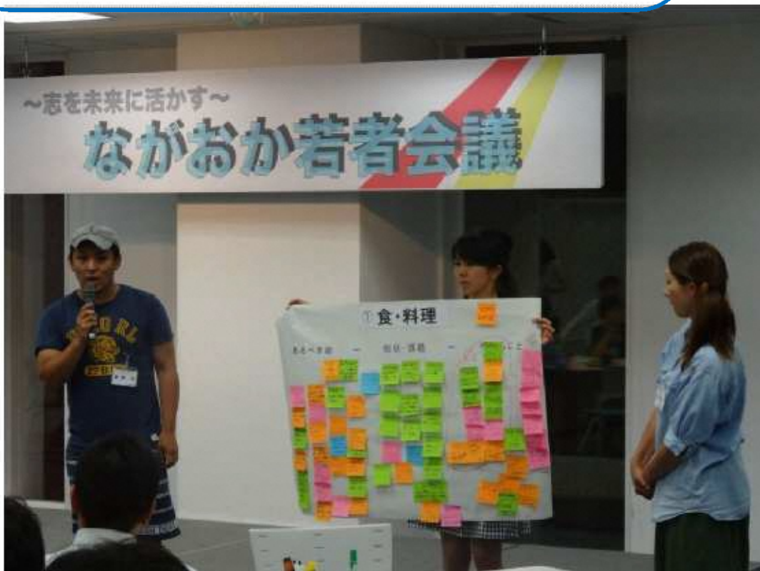
▲30代までの若者がまちづくりを提案する場「ながおか若者会議」