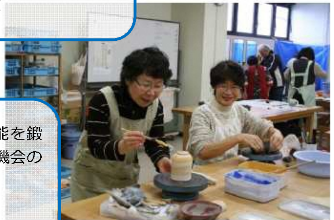
▲趣味の教室（焼物講座）