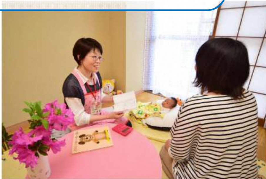
▲産後ケアコーディネーターがお母さんに寄り添います