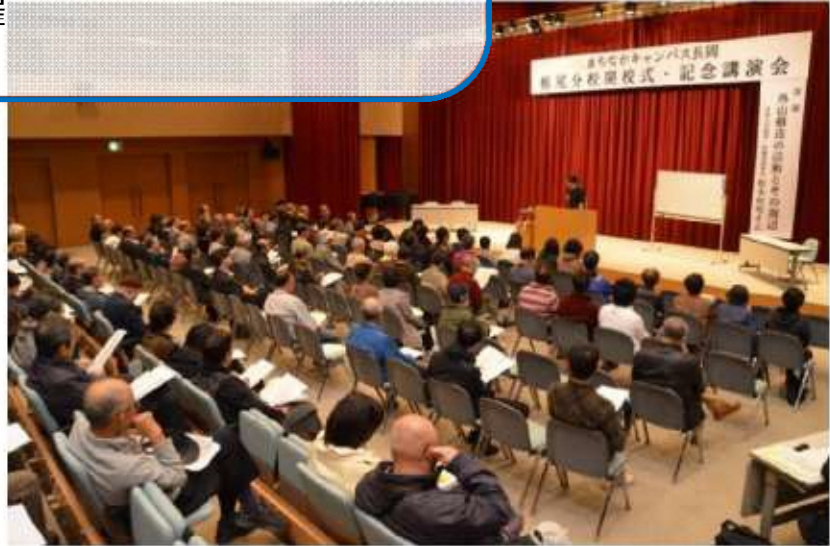
▲まちなかキャンパス長岡栃尾分校の開校式（平成 27 年 11 月）