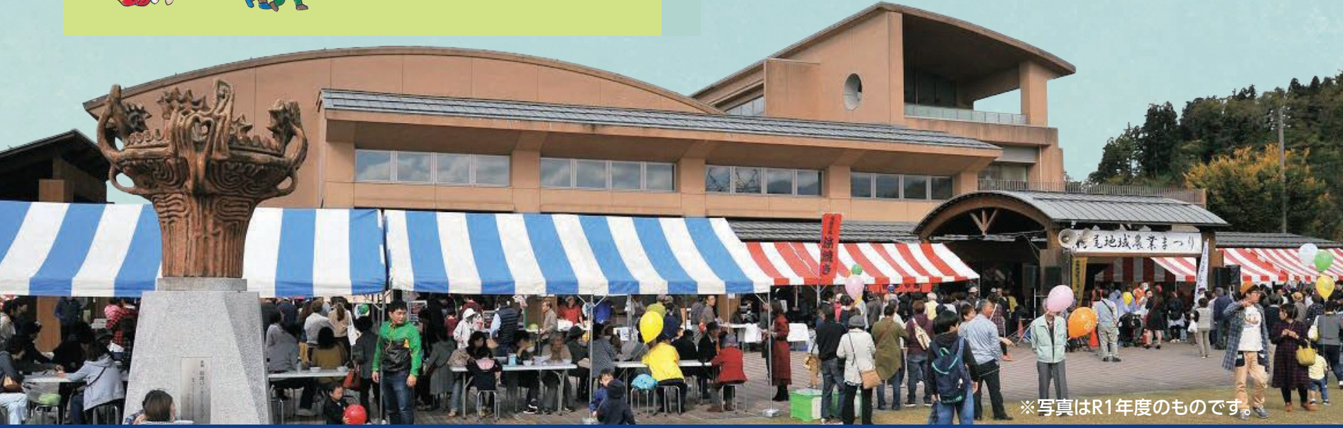
※写真はR1年度のものです。