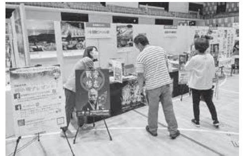
各地域がブースを出典