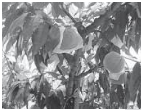
刈羽村の砂丘桃や栃尾てまりなどが購入可能！

パンフレット配布、ノベルティ配布、ゆるきゃらイベント、PV映像、施設紹介、地域の特産物販売等