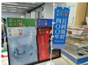
アオーレ長岡総合窓口