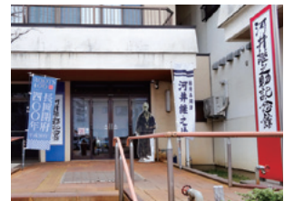
河井継之助記念館