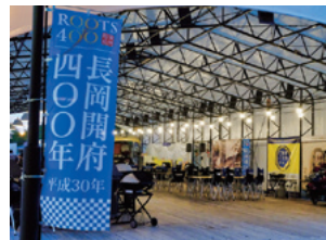
与板★中川清兵衛記念 BBQビール園