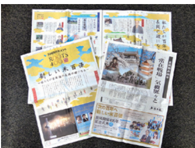
平成30年5月26日 新潟日報特集