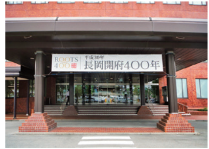
さいわいプラザ正面玄関