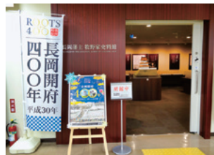
長岡藩主牧野家史料館