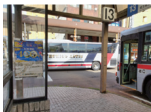
長岡駅バス乗り場