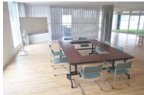
▲管理棟 休憩ホール