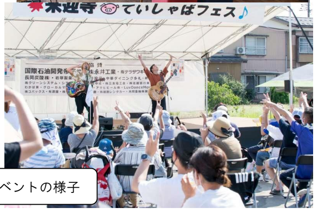
越路地域のイベントの様子