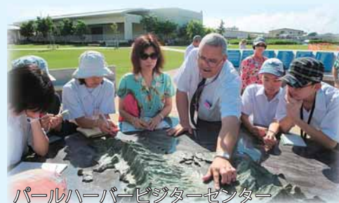
パールハーバービジターセンター