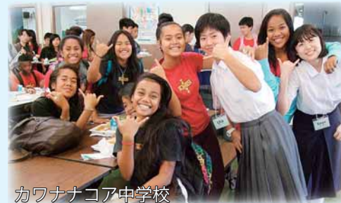
カワナナコア中学校

両市の中学生が、互いの歴史・文化を学びながら、平和について話し合い、未来に向かって平和を訴える平和宣言を行います。 7月31日～8月3日…長岡市 8月13日～16日…ホノルル市