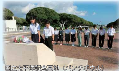
国立太平洋記念墓地 (パンチボウル)