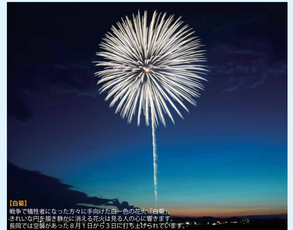
【白菊】戦争で犠牲者になった方々に手向けた白一色の花火「白菊」。きれいな円を描き静かに消える花火は見る人の心に響きます。長岡では空襲があった8月1日から3日に打ち上げられています。