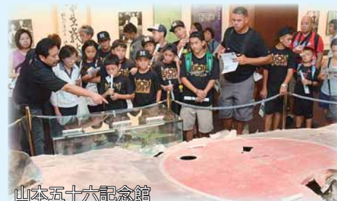
山本五十六記念館

長岡戦災資料館、山本五十六記念館、太平洋航空博物館等が連携し互いの歴史や平和の大切さを未来に伝えるためにシンポジウムを開催します。 8月15日…ホノルル市内