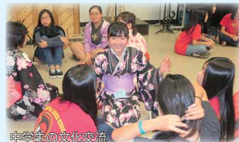
中学生の文化交流

長岡市民がホノルル市での追悼式や花火観覧に参加するほか、文化交流を通してホノルル市民との相互理解を深めます。 8月13日～15日…ホノルル市内