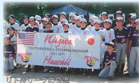
リトルリーグの交流