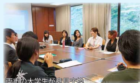
両市の大学生が意見交換

両大学が交換留学や共同演習など相互交流を進めるための協定締結します。 8月14日…ハワイ大学マノア校