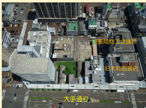
着手時(令和2年6月撮影)

昨年5月から進めてきましたA街区の解体工事が皆様のご理解とご協力により、本年2月末で完了しました。