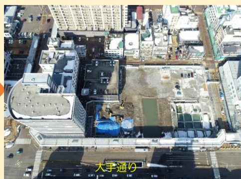
完了(令和3年2月撮影)

4月からは引き続き、新築工事に着手する予定です。皆様には引き続きご迷惑をおかけしますが、ご理解のほどお願い申し上げます。