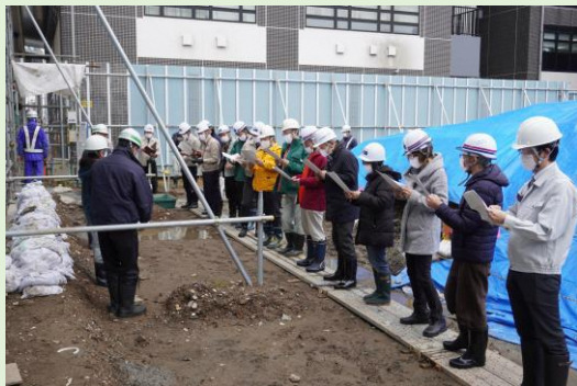
埋蔵文化財発掘調査見学会の様子

大手通坂之上町地区再開発事業地の一部については、かつての長岡城の堀に位置していたことがわかっており、現在、長岡市教育委員会科学博物館によって埋蔵文化財の発掘調査が行われています。