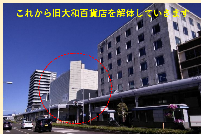
これから旧大和百貨店を解体してまいります