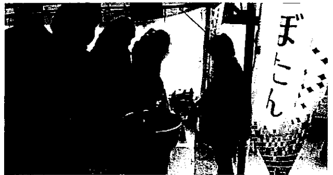
当日は自家製のお漬物も添えて、150食を販売。