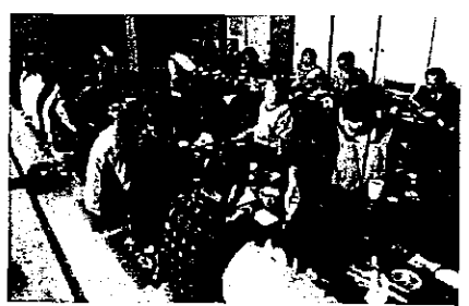
笑顔のひと時。喜んでいただきました。

2月26日(土)の武蔵野市民交流ツアーでは、小国支所からの依頼により、昼食の提供を行いました。 昼食として用意したのは「霜花御膳」という、晩冬のふるさと薬膳料理です。晩冬ということ、身体が温まる食材で構成した献立に、武蔵野市の方はとても興味を持たれたようでした。料理を積極的に進めるメンバーの姿もあり、会場は終始和やかムードでした。 メンバーが手ずから作った料理に、田舎のゆったりとした時間を味わっていただけただけではないでしょうか。