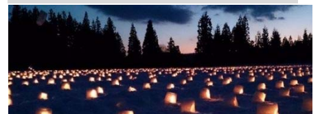
えちごかわぐち雪洞火ほたる祭