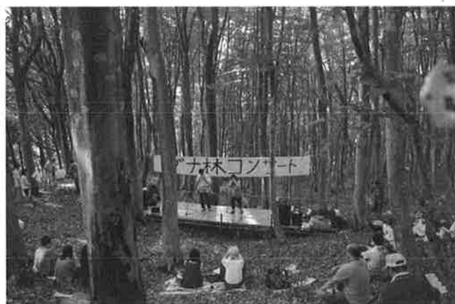
コンサート⑤ (オカリナ)