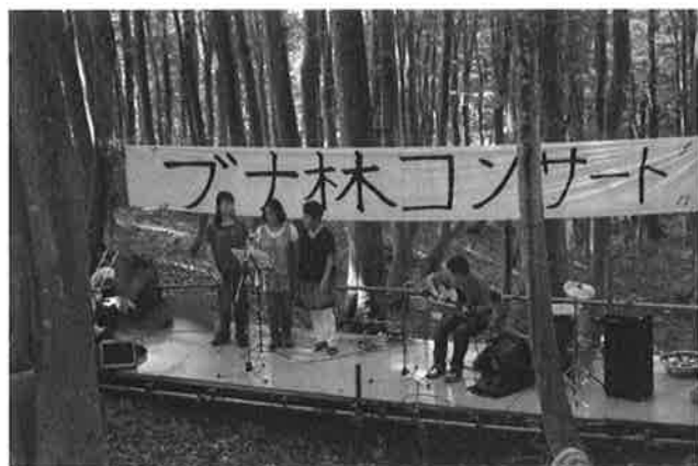
コンサート① (コーラス)