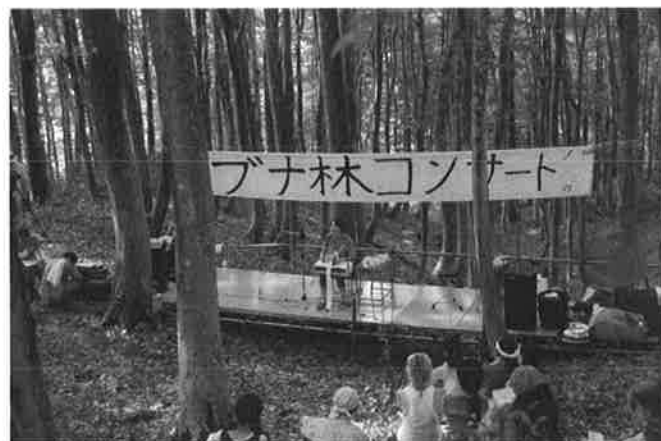
コンサート⑥ (オルゴール)