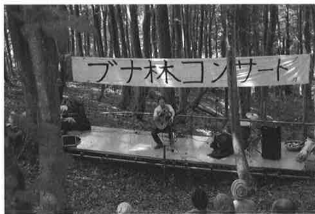
コンサート④ (ギター)