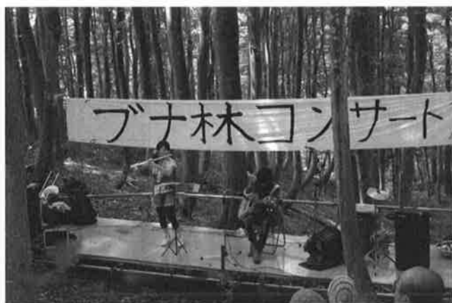
コンサート③ (フルート、ギター)