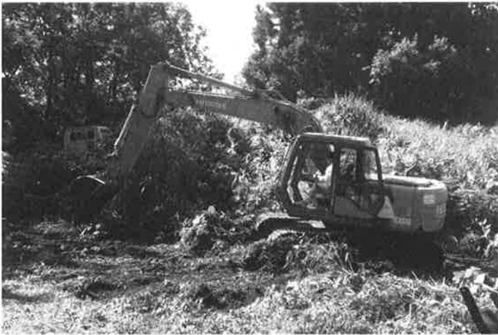
重機による遊歩道整備