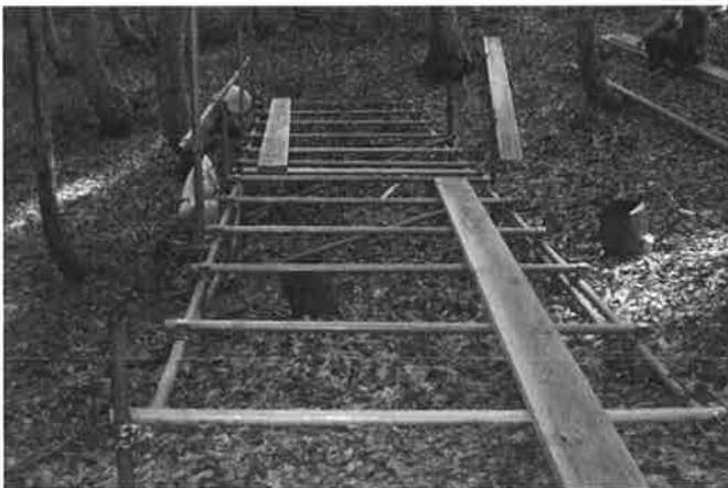
ステージ設置作業