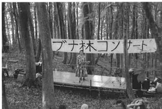
コンサート② (ソプラノ)