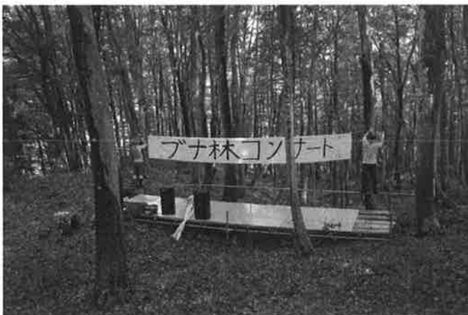
ステージ飾りつけ