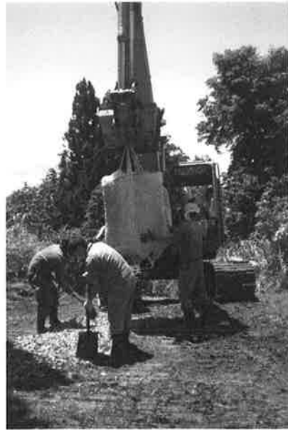
ウッドチップ敷設作業