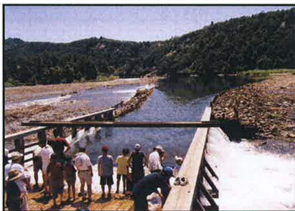
30 観光客でにぎわう川口やな場