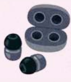
ワイヤレスイヤホン