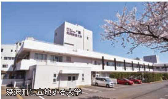
深沢町に立地する大学

中越地域初の看護大学となる長岡崇徳大学が4月1日、開学しました。 一期生は43人で、長野県や山形県など市外の出身者は約8割の34人です。高度医療に対応できる看護師を育成するほか、若者の定着や市の魅力向上も期待されます。市はこれまで施設整備費などを支援してきました。