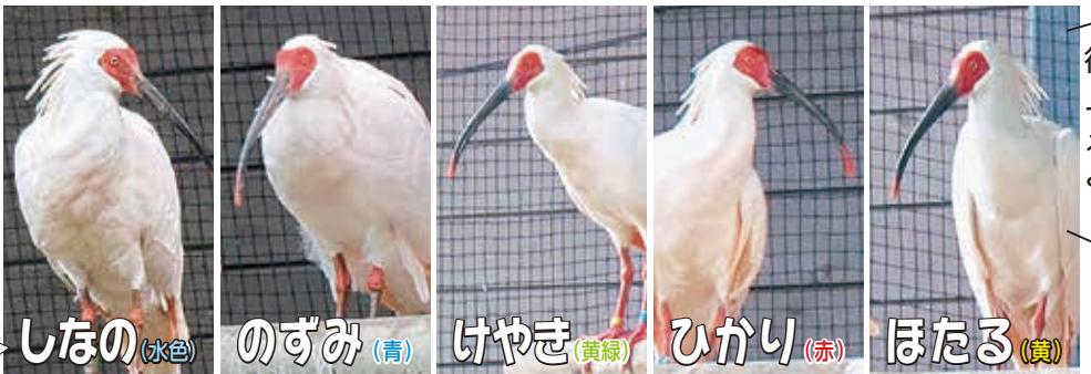
しなの(水色) のずみ(青) けやき(黄緑) ひかり(赤) ほたる(黄)

愛称の由来は？ たくさんの人たちに、トキの愛称を通じて長岡のこと(信濃川、寺泊野積、市の木「ケヤキ」、コシヒカリ、ホテル)を知ってもらいたいとの思いから。 ※5羽それぞれに( )内の色の足環を付けます