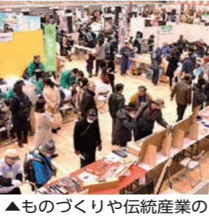
▲ものづくりや伝統産業の魅力を紹介