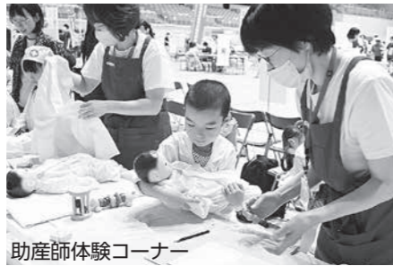
助産師体験コーナー

日時：9月12日(土)・13日(日) 場所：アオーレ長岡 内容：授産製品の販売、健康コーナーなど 対象：原則、市内で福祉や健康に関する活動をしている団体 申込：HPで(多数の場合は抽選) 閩福祉総務課 ☎39・2371