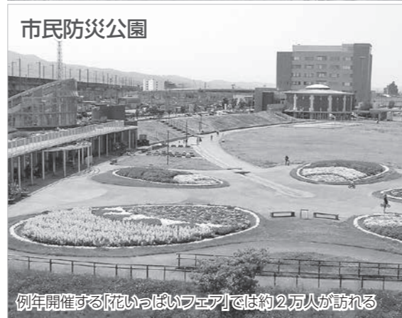
例年開催する「花いっぱいフェア」では約2万人が訪れる