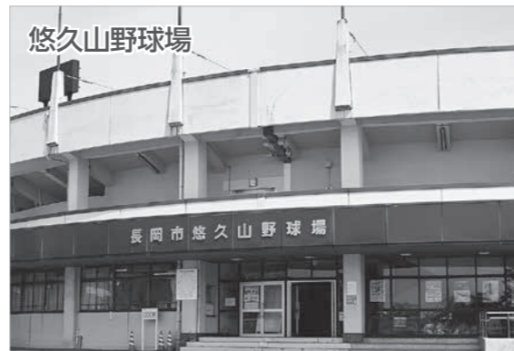
プロ野球や高校野球などさまざまな試合が行われる