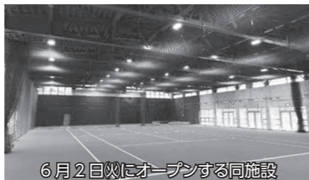
6月2日(日)にオープンする同施設