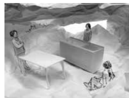
◀紙とボンドで作ります。アナの家