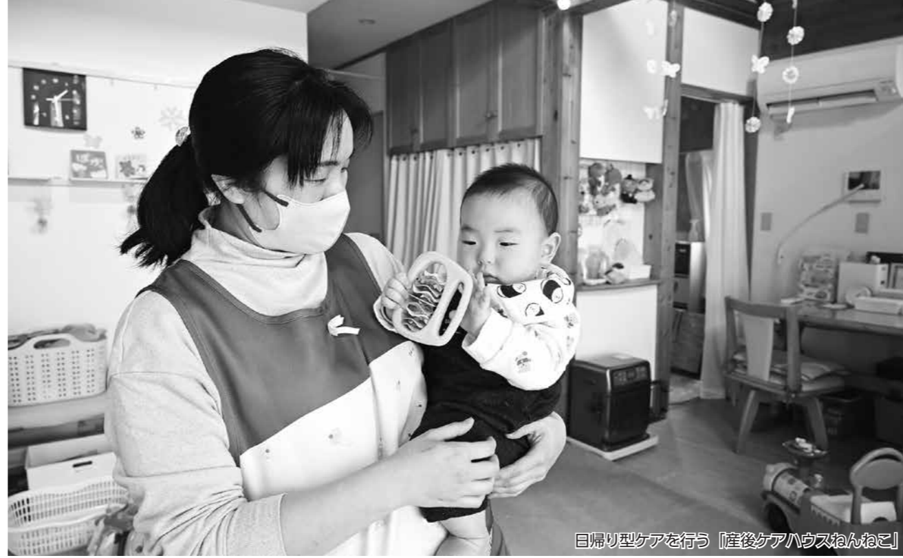
日帰り型ケアを行う「産後ケアハウスねんねこ」