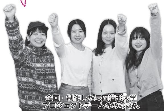
企画・制作した長岡造形大学プロジェクトチームのみなさん