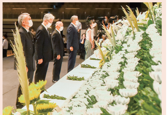
▶ 昨年の式典での献花

1 長岡市平和祈念式典 8月1日(火)午前9時～10時 場アオーレ長岡 内代表献花、長岡空襲体験者の話など