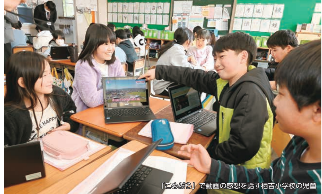
「こめぷら」で動画の感想を話す栖吉小学校の児童