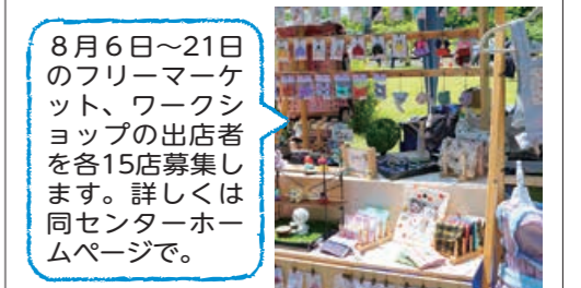
8月6日～21日のフリーマーケット、ワークショップの出店者を各15店募集します。詳しくは同センターホームページで。

③中之島体育館 ☎66・1711 ☎・時①シェイプボクシング…午前 10時～11時②トランポピクス…午後 1時～2時③ペタンク…午後2時30 分～4時 ☎①②中学生以上 定① ②20人(先着)③24人(先着) 時内履き ☎8月6日(土)から同体育館へ