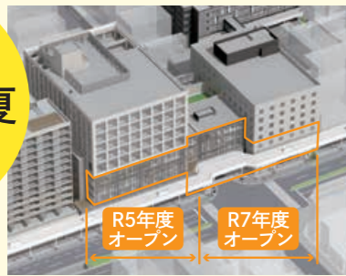
米百俵プレイス ミライエ長岡(大手通2)

「ミライエ長岡」専用ウェブサイト https://miraie-nagaoka.jp