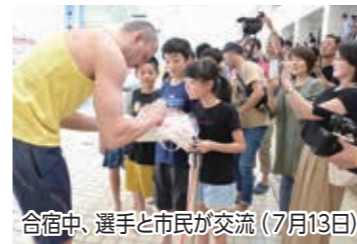
合宿中、選手と市民が交流 (7月13日)