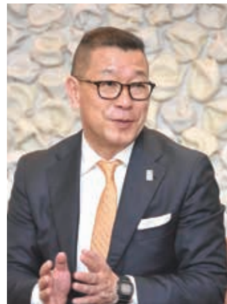
Bリーグチェアマン 大河正明さん

いよいよ10月に、バスケットボールBリーグの2019-20シーズンの1部リーグ戦が開幕します。9月には、その前哨戦となる「アーリーカップ」がアオーレ長岡で行われます。本格的なバスケシーズンに向け、Bリーグのチェアマン（理事長）・大河正明さんに「バスケのまち長岡」の評価とこれからの展望を聞きました。岡市民協働課 ☎39・2288