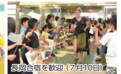
長岡合宿を歓迎 (7月10日)

岡スポーツ振興課オリンピック・パラリンピック事前キャンプ誘致推進室 ☎32・6117