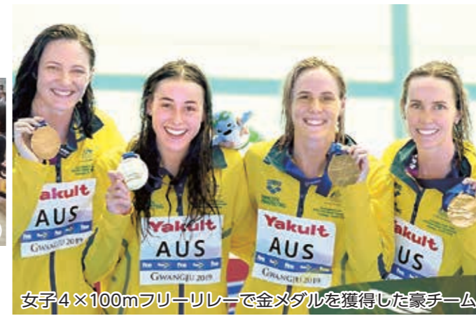
女子4×100mフリーリレーで金メダルを獲得した豪チーム