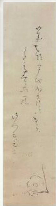
良寛画賛 軸装「きてはうち」 (良寛の里美術館蔵 長岡市指定文化財)