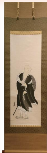
良寛和尚像(遍澄)複製