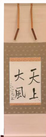
天上大風(良寛)複製