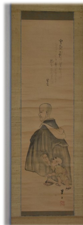
良寛肖像 五十嵐華亭画 由之讚