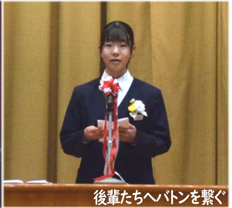
後輩たちへバトンを繋ぐ