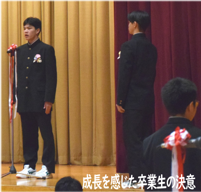
成長を感じた卒業生の決意

長岡市和島支所地域振興・市民生活課 〒949-4511 長岡市小島谷3434番地4 TEL. 0258-74-3112 FAX. 0258-74-2791 E-mail. wsm-chiiki@city.nagaoka.lg.jp 第198号 令和8年4月1日