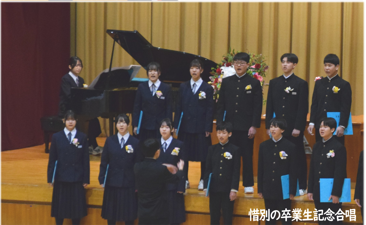
惜別の卒業生記念合唱

3月3日、北辰中学校卒業生20名に卒業証書が授与されました。未来への希望を胸に、卒業生はそれぞれの夢に向け、新たな一步を踏み出しました。