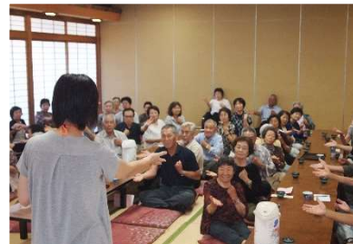
健康づくり合同研修会