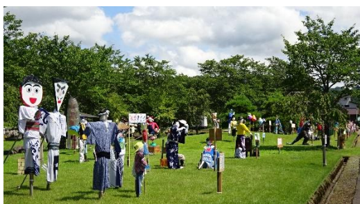
◀おぐにかかしまつりの様子

その他：個人・グループどちらでも出品できます。 審査のうえ、優秀作品を表彰します。