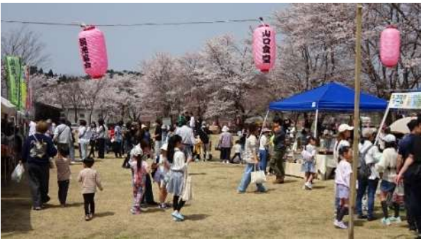
昨年度のまつりの様子