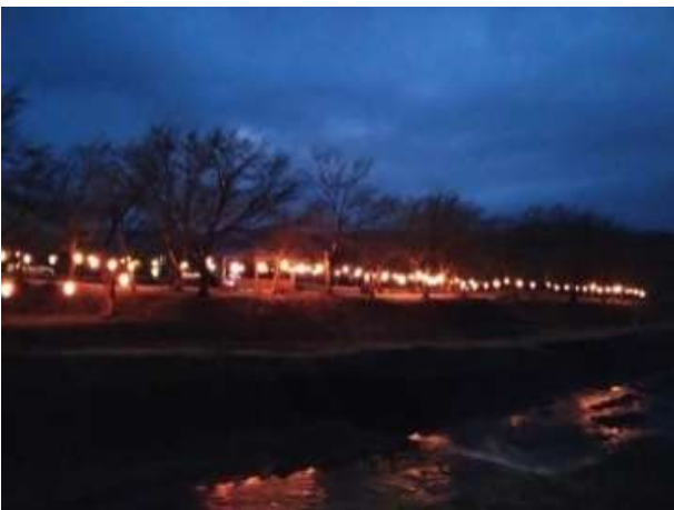
昨年度のライトアップの様子