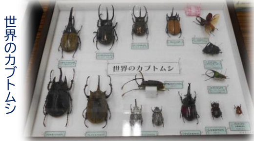
世界のカブトムシ