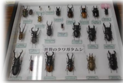
世界のクワガタムシ