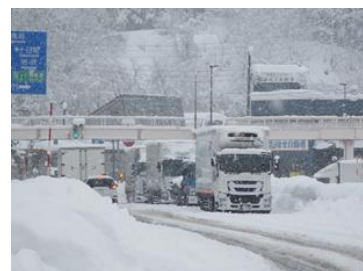
【令和4年12月 国道17号渋滞の様子】