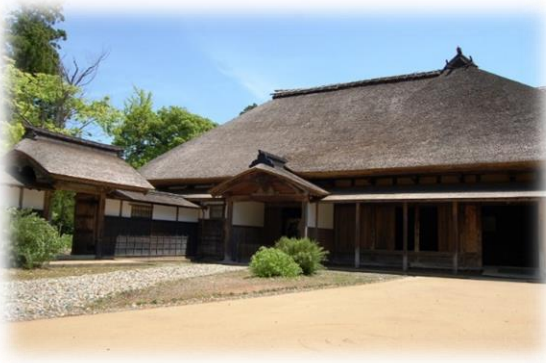
旧長谷川邸 主屋全景